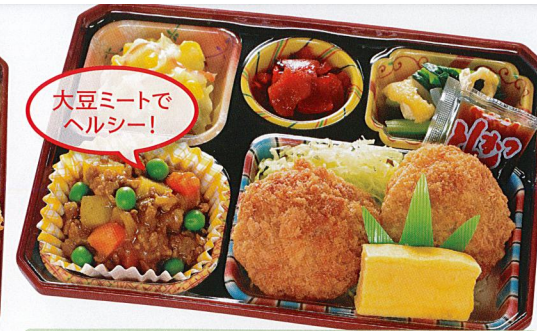
19 ミニとんかつ&カレー 熱量 413kcal タンパク質 18.3g 脂質 22.3g 炭水化物 38.9g 食塩相当量 3.5g 使用原料 卵 乳 小麦 そば 落花生 エビ カニ