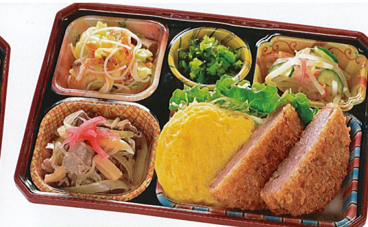
21 ハムカツ・牛丼風煮 熱量 465kcal タンパク質 17.8g 脂質 23.9g 炭水化物 43.5g 食塩相当量 2.6g 使用原料 卵 乳 小麦 そば 落花生 エビ カニ