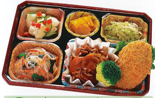
31 デミソース煮 熱量 391kcal タンパク質 11.8g 脂質 20.3g 炭水化物 38.4g 食塩相当量 2.2g 使用原料 卵 乳 小麦 そば 落花生 エビ カニ