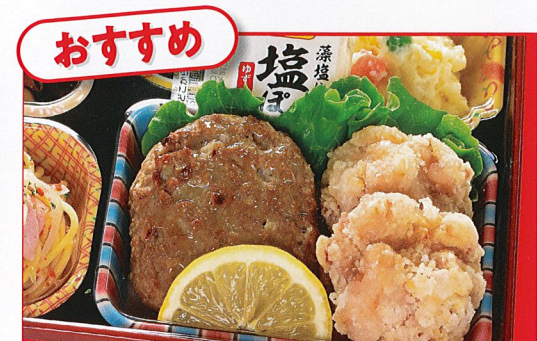
26 レモン塩ポン唐揚げ 熱量 489kcal タンパク質 22.7g 脂質 28.2g 炭水化物 33.0g 食塩相当量 3.9g 使用原料 卵 乳 小麦 そば 落花生 エビ カニ