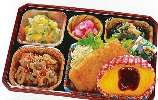
24 串フライ 熱量 328kcal タンパク質 9.6g 脂質 16.8g 炭水化物 33.9g 食塩相当量 3.1g 使用原料 卵 乳 小麦 そば 落花生 エビ カニ