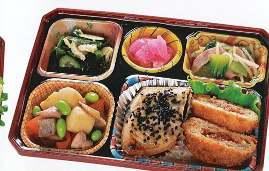
28 トマト包みメンチ 熱量 432kcal タンパク質 20.8g 脂質 24.9g 炭水化物 30.4g 食塩相当量 3.6g 使用原料 卵 乳 小麦 そば 落花生 エビ カニ