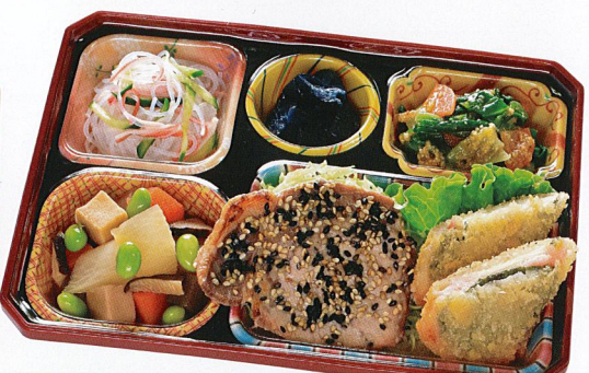
25 豚肉のセサミ焼き 熱量 336kcal タンパク質 15.1g 脂質 15.4g 炭水化物 33.2g 食塩相当量 2.8g 使用原料 卵 乳 小麦 そば 落花生 エビ カニ