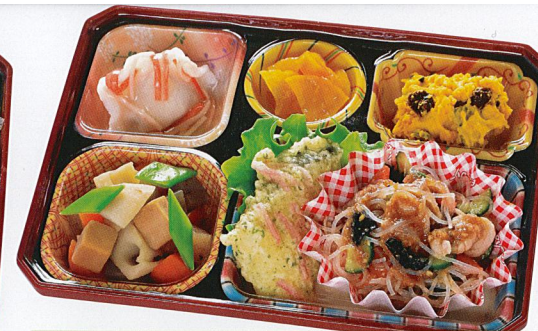
20 豚しゃぶ風 熱量 412kcal タンパク質 18.6g 脂質 17.9g 炭水化物 40.7g 食塩相当量 2.7g 使用原料 卵 乳 小麦 そば 落花生 エビ カニ