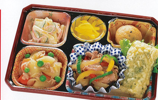
27 いか天・生姜焼き 熱量 495kcal タンパク質 22.6g 脂質 26.0g 炭水化物 30.7g 食塩相当量 3.0g 使用原料 卵 乳 小麦 そば 落花生 エビ カニ