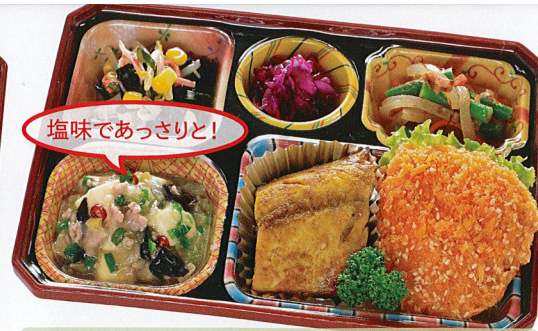
18 ごま味噌チキンカツ 熱量 410kcal タンパク質 21.4g 脂質 25.6g 炭水化物 11.6g 食塩相当量 3.2g 使用原料 卵 乳 小麦 そば 落花生 エビ カニ