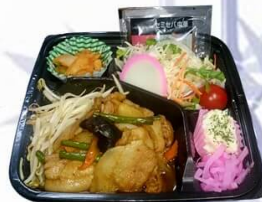
スタミナ焼肉弁当 500円