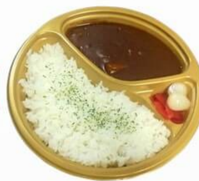
ポークカレー 500円 ※ミニサラダ付き