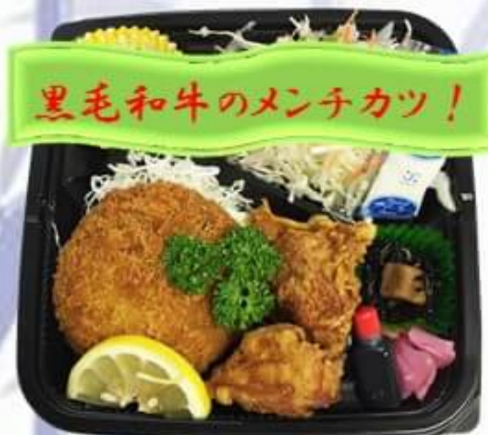
メンチカツ弁当 500円