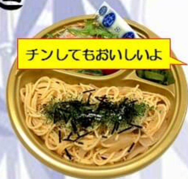
明太パスタ弁当 500円