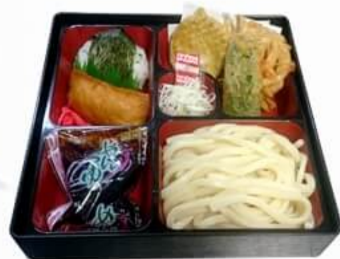
冷やしうどん弁当 600円 ※蕎麦に変更可能です