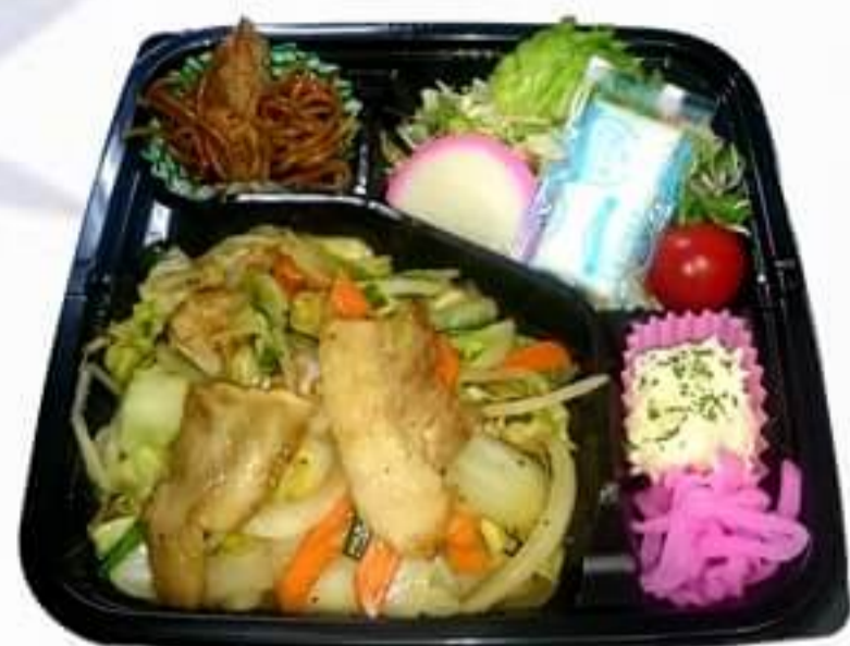
肉野菜炒め弁当 500円