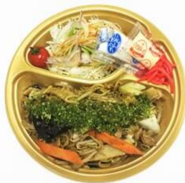
焼きそば 500円 ※焼きうどんもございます