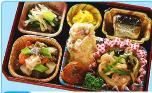
11 チンジャオロース 熱量 421kcal タンパク質 19.7g 脂質 23.5g 使用原料 卵 乳 小麦 大豆 鶏肉 エビ カニ