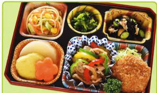
30 焼き肉&ヒレカツ弁当 熱量 411kcal タンパク質 20.1g 脂質 19.1g 使用原料 卵 乳 小麦 大豆 鶏肉 エビ カニ