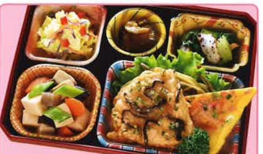
19 豚肉の和風唐揚げ 熱量 352kcal タンパク質 15.8g 脂質 16.3g 使用原料 卵 乳 小麦 大豆 鶏肉 エビ カニ