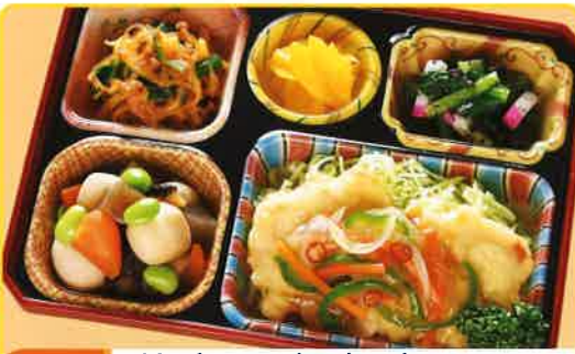
8 鶏肉の南蛮漬け風 熱量 307kcal タンパク質 13.8g 脂質 11.0g 使用原料 卵 乳 小麦 大豆 鶏肉 エビ カニ