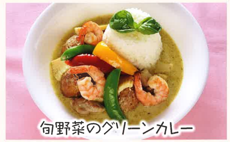
旬野菜のグリーンカレー