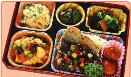
24 魚竜田の彩り甘酢・麻婆豆腐 熱量 454kcal タンパク質 22.1g 脂質 24.1g 使用原料 卵 乳 小麦 大豆 鶏肉 エビ カニ