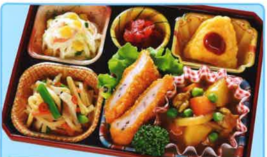
18 カレー&イカカツ 熱量 421kcal タンパク質 15.5g 脂質 22.8g 使用原料 卵 乳 小麦 大豆 鶏肉 エビ カニ