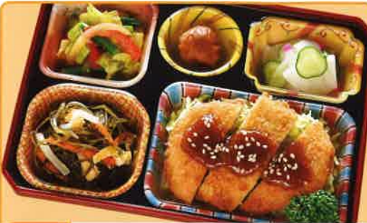
15 みそとんかつ 熱量 362kcal タンパク質 13.5g 脂質 14.1g 使用原料 卵 乳 小麦 大豆 鶏肉 エビ カニ