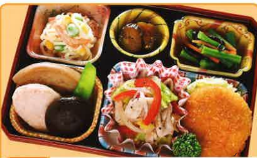
1 塩だれ焼き肉 熱量 421kcal タンパク質 14.7g 脂質 23.8g 使用原料 卵 乳 小麦 大豆 鶏肉 エビ カニ