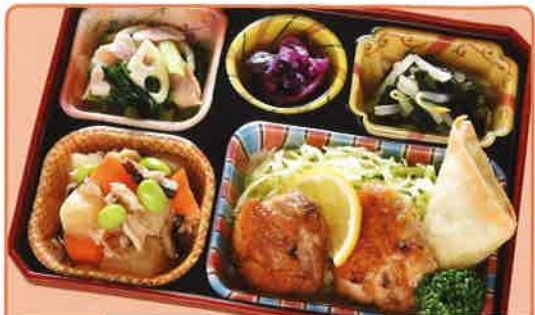
17 鶏肉のスタミナ焼き 熱量 335kcal タンパク質 18.3g 脂質 16.7g 使用原料 卵 乳 小麦 大豆 鶏肉 エビ カニ