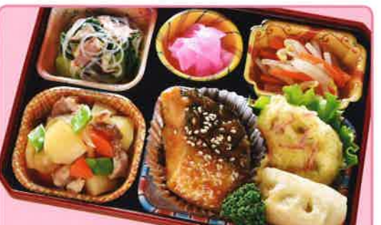
26 魚の味噌煮風 熱量 386kcal タンパク質 17.6g 脂質 17.0g 使用原料 卵 乳 小麦 大豆 鶏肉 エビ カニ