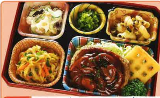
10 デミグラスハンバーグ 熱量 401kcal タンパク質 16.5g 脂質 19.6g 使用原料 卵 乳 小麦 大豆 鶏肉 エビ カニ