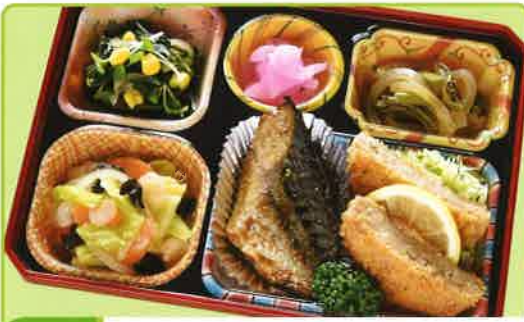
9 さっくりメンチカツ 熱量 404kcal タンパク質 17.4g 脂質 24.3g 使用原料 卵 乳 小麦 大豆 鶏肉 エビ カニ