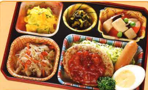
29 ハンバーグトマトバジルソース 熱量 389kcal タンパク質 17.8g 脂質 20.4g 使用原料 卵 乳 小麦 大豆 鶏肉 エビ カニ