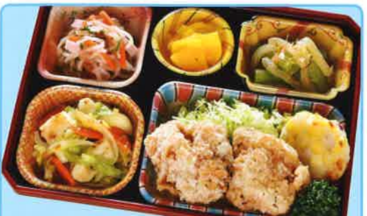
25 鶏の唐揚げ・黒胡椒炒め 熱量 321kcal タンパク質 17.7g 脂質 17.3g 使用原料 卵 乳 小麦 大豆 鶏肉 エビ カニ