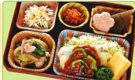
16 白身魚のナポリタンソース 熱量 380kcal タンパク質 19.1g 脂質 19.8g 使用原料 卵 乳 小麦 大豆 鶏肉 エビ カニ