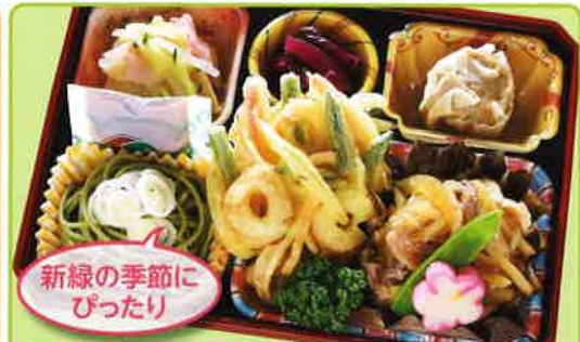
23 豚丼風・茶そば 熱量 379kcal タンパク質 16.6g 脂質 13.5g 使用原料 卵 乳 小麦 そば 大豆 鶏肉 エビ カニ