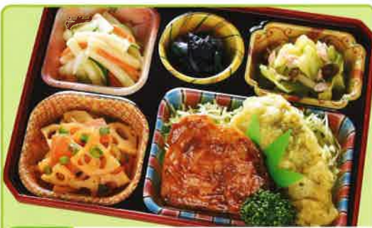
2 BBQポーク 熱量 307kcal タンパク質 14.1g 脂質 14.2g 使用原料 卵 乳 小麦 大豆 鶏肉 エビ カニ