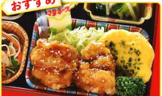
31 照りマヨチキン 熱量 447kcal タンパク質 18.4g 脂質 24.8g 使用原料 卵 乳 小麦 大豆 鶏肉 エビ カニ