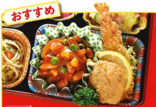
12 エビフライ・チリビーンズ 熱量 439kcal タンパク質 17.0g 脂質 22.3g 使用原料 卵 乳 小麦 大豆 鶏肉 エビ カニ