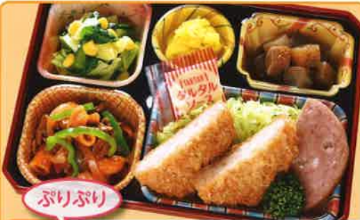
22 エビカツのタルタルソース 熱量 400kcal タンパク質 17.6g 脂質 21.0g 使用原料 卵 乳 小麦 大豆 鶏肉 エビ カニ