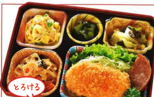
24 クリームコロッケ 熱量 413kcal タンパク質 9.7g 脂質 24.8g 使用原料 卵 乳 小麦 そば 落花生 エビ カニ