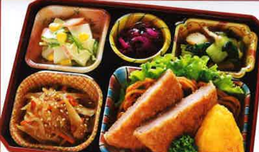
15 厚切りハムカツ 熱量 490kcal タンパク質 14.6g 脂質 23.9g 使用原料 卵 乳 小麦 そば 落花生 エビ カニ