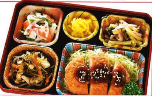
29 厚切りみそとんかつ 熱量 425kcal タンパク質 16.5g 脂質 25.1g 使用原料 卵 乳 小麦 そば 落花生 エビ カニ