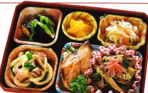
22 牛ごぼう・魚の辛味焼き 熱量 381kcal タンパク質 18.9g 脂質 16.9g 使用原料 卵 乳 小麦 そば 落花生 エビ カニ