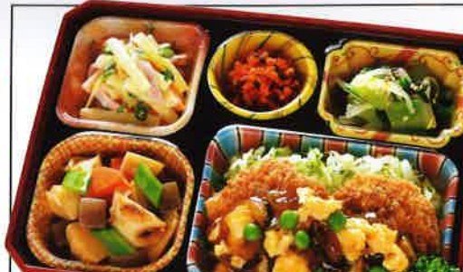
18 ひれかつのとろ玉あんかけ 熱量 347kcal タンパク質 16.7g 脂質 13.7g 使用原料 卵 乳 小麦 そば 落花生 エビ カニ