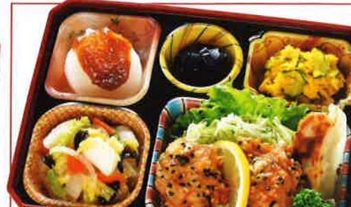
19 鶏肉のセサミ揚げ 熱量 386kcal タンパク質 16.0g 脂質 20.9g 使用原料 卵 乳 小麦 そば 落花生 エビ カニ