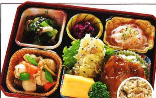
23 ポークジンジャー 炊き込みご飯 熱量 309kcal タンパク質 15.1g 脂質 11.3g 使用原料 卵 乳 小麦 そば 落花生 エビ カニ