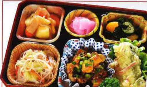
17 麻婆豆腐・魚の変わり揚げ 熱量 371kcal タンパク質 17.0g 脂質 15.4g 使用原料 卵 乳 小麦 そば 落花生 エビ カニ