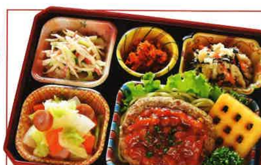
26 ハンバーグトマトバジルソース 熱量 410kcal タンパク質 17.1g 脂質 17.1g 使用原料 卵 乳 小麦 そば 落花生 エビ カニ