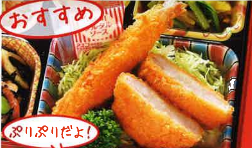
16 エビフライ&エビカツ 熱量 411kcal タンパク質 18.2g 脂質 19.8g 使用原料 卵 乳 小麦 そば 落花生 エビ カニ