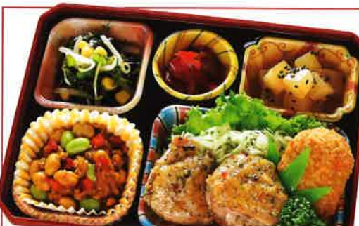
31 ハーブチキン・キーマカレー 熱量 435kcal タンパク質 21.7g 脂質 26.6g 使用原料 卵 乳 小麦 そば 落花生 エビ カニ