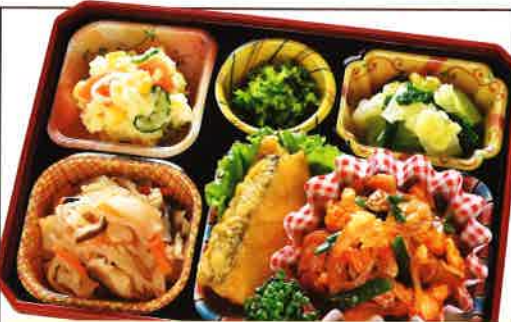
30 豚肉のチリソース炒め 熱量 377kcal タンパク質 16.3g 脂質 19.3g 使用原料 卵 乳 小麦 そば 落花生 エビ カニ