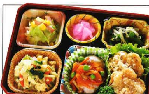
25 鶏肉の唐揚げ・卵とじ 熱量 362kcal タンパク質 22.1g 脂質 18.7g 使用原料 卵 乳 小麦 そば 落花生 エビ カニ