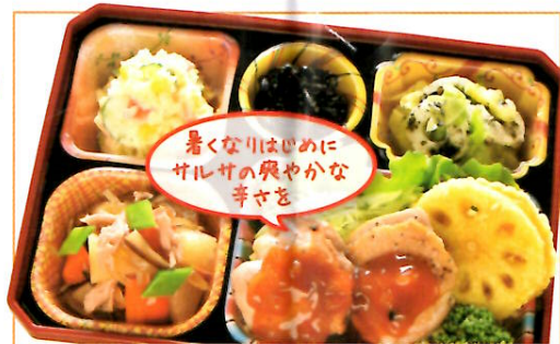
16 スパイスチキンのサルサソース 熱量 381kcal タンパク質 17.1g 脂質 20.5g 使用原料 卵 乳 小麦 そば 落花生 エビ カニ