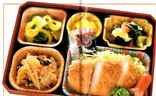
30 ソースとんかつ 熱量 403kcal タンパク質 15.2g 脂質 24.7g 使用原料 卵 乳 小麦 そば 落花生 エビ カニ