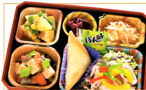
25 ぽん酢豚しゃぶ 熱量 299kcal タンパク質 17.5g 脂質 13.5g 使用原料 卵 乳 小麦 そば 落花生 エビ カニ