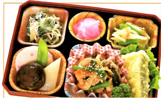
14 韓国風焼き肉 熱量 336kcal タンパク質 18.9g 脂質 17.2g 使用原料 卵 乳 小麦 そば 落花生 エビ カニ