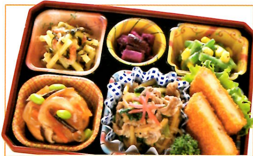
21 牛肉と竹の子のしぐれ煮 熱量 405kcal タンパク質 17.4g 脂質 19.3g 使用原料 卵 乳 小麦 そば 落花生 エビ カニ