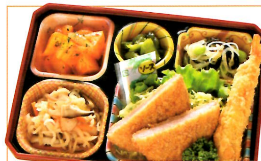
18 ミックスフライ (ハム&エビ) 熱量 413kcal タンパク質 13.1g 脂質 16.8g 使用原料 卵 乳 小麦 そば 落花生 エビ カニ