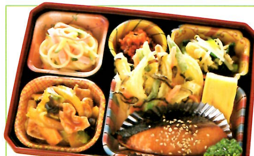
17 魚の醤油みりん焼き・回鍋肉 熱量 387kcal タンパク質 19.1g 脂質 21.4g 使用原料 卵 乳 小麦 そば 落花生 エビ カニ