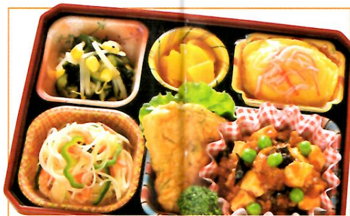
23 中華風弁当 (豚肉の唐揚げ) 熱量 387kcal タンパク質 17.0g 脂質 20.8g 使用原料 卵 乳 小麦 そば 落花生 エビ カニ