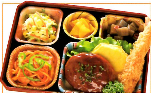
28 煮込みハンバーグ・エビフライ 熱量 469kcal タンパク質 16.5g 脂質 23.9g 使用原料 卵 乳 小麦 そば 落花生 エビ カニ