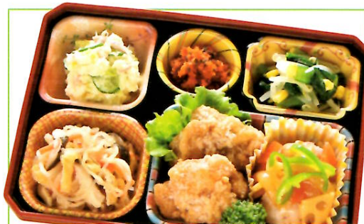
31 鶏肉の唐揚げ・イカ団子の甘酢あん 熱量 409kcal タンパク質 18.9g 脂質 23.5g 使用原料 卵 乳 小麦 そば 落花生 エビ カニ