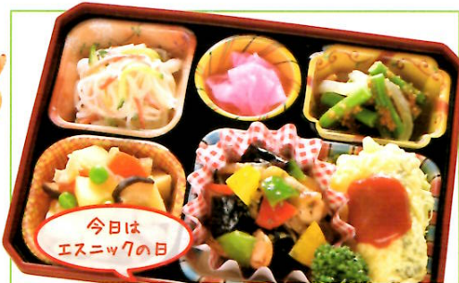
29 チキンのバジル炒め 熱量 403kcal タンパク質 17.7g 脂質 21.8g 使用原料 卵 乳 小麦 そば 落花生 エビ カニ