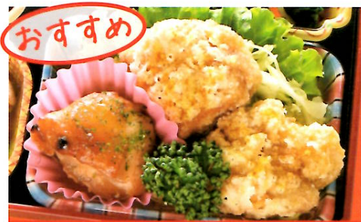
22 鶏肉のカレー揚げ 熱量 349kcal タンパク質 17.4g 脂質 19.6g 使用原料 卵 乳 小麦 そば 落花生 エビ カニ