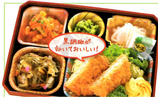
15 九州産黒豚メンチカツ 熱量 400kcal タンパク質 12.4g 脂質 19.3g 使用原料 卵 乳 小麦 そば 落花生 エビ カニ